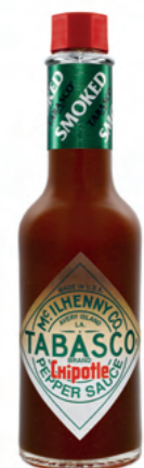
TABASCO® Chipotle 12 x 150 mL 8714100810514