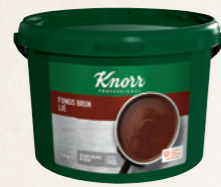
Fonds Brun Lié 1 x 3,5 kg • jusqu'à 140 L 8711200469604