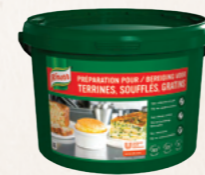
Préparation pour terrines, soufflés, gratins 1 x 3,2 kg • jusqu'à 250 L 8714100813874