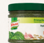
Pesto 2 x 340 g 8711100647416