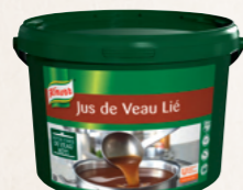
Jus de Veau Lié 1 x 4 kg • jusqu'à 160 L 8711200469628