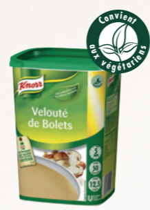
Velouté de Bolets 6 x 940 g • jusqu'à 12,5 L 8722700094883