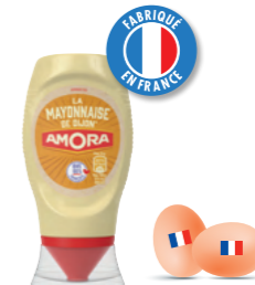
Petit Mayonnaisier 9 x 225 g 8711327450042