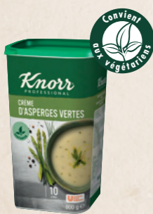
Crème d'Asperges Vertes 6 x 900 g • jusqu'à 10 L 8712566440757