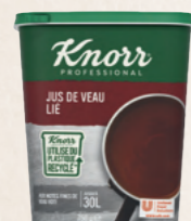
Jus de Veau Lié 6 x 750 g • jusqu'à 30 L 8711200461875