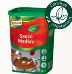
Madère 6 x 800 g • jusqu'à 8 L 3011360024794