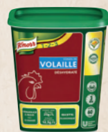
Fonds de Volaille 6 x 750 g • jusqu'à 60 L 8712566087747