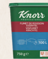
Fumet de Poisson 6 x 750 g • jusqu'à 100 L 8712566087686