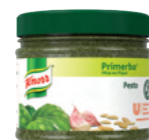
Pesto 2 x 340 g 8711100647416