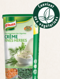
Crème & Fines Herbes 6 x 1 kg 8722700017332