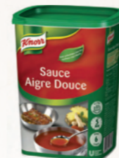
Aigre Douce 6 x 1,2 kg • jusqu'à 6 L 8712566218714