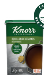
Bouillon de Légumes 6 x 1,2 kg • jusqu'à 60 L 8720182842008