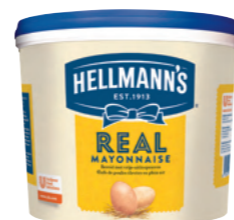
"Real" Mayonnaise Seau 1 x 4,65 kg 8720182759054