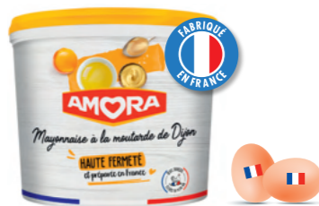
Mayonnaise Haute fermeté 1 x 4,7 kg 8720182273840