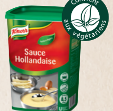
Hollandaise 6 x 825 g • jusqu'à 8,5 L 3011360040480