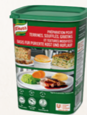
Préparation pour terrines, soufflés, gratins 6 x 720 g • jusqu'à 60 L 8714100813867