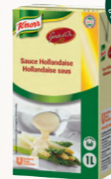
Hollandaise 6 x 1 L • 20 portions 8712100491818