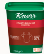
Fonds Brun Lié 6 x 750 g • jusqu'à 37 L 8712566087525