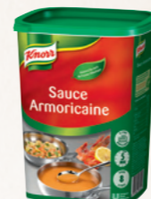
Armoricaine 6 x 800 g • jusqu'à 8 L 8712566265022