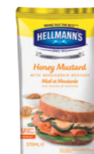
Miel & Moutarde avec graines de moutarde 5 x 570 mL 8712100473494