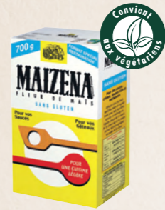
Maïzena® Fleur de Maïs 12 x 700 g • jusqu'à 35 L 3011360010940