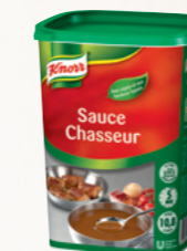
Chasseur 6 x 920 g • jusqu'à 10,8 L 8712566218653