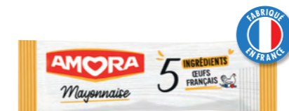
Mayonnaise 200 x 10 mL 8720182299420