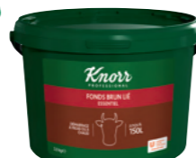
Fonds Brun Lié 1 x 3 kg • jusqu'à 150 L 8714100692608