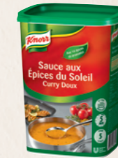
Épices du Soleil 6 x 1 kg • jusqu'à 5 L 8722700187721