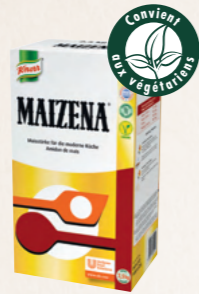
Maïzena® Fleur de Maïs 2,5kg 9000275801419