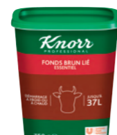
Fonds Brun Lié 6 x 750 g • jusqu'à 37 L 8712566087525