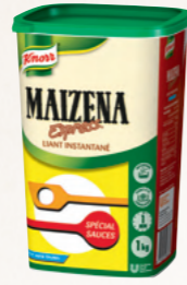
Maïzena® Express 6 x 1 kg • jusqu'à 25 L 8711200506330