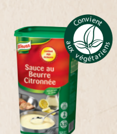
Beurre Citronné 6 x 1 kg • jusqu'à 5,25 L 8711200573295