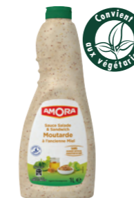
Sauce Salade Moutarde à l'ancienne Miel 6 x 1 L 8710522712276