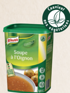
Soupe à l'Oignon 6 x 565 Kg • jusqu'à 12,5 L 3011360041142