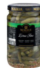
Cornichons Extra-fins Sélection Grand Croquant 6 x 950 g 8717163793282