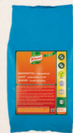
Liant déshydraté 2 x 2kg 8711200570478