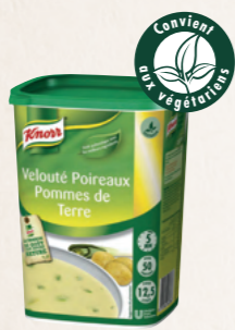
Velouté Poireaux Pommes de Terre 6 x 815 g • jusqu'à 12,5 L 8712566460366