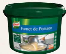
Fumet de Poisson 1 x 3,6 kg • jusqu'à 240 L 8711200469611