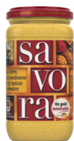
Savora 12 x 385 g 8712100731822