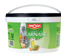
Sauce Béarnaise 1 x 2,7 kg 8710522804568