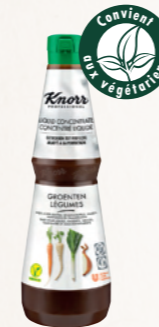
Légumes 6 x 1 L 8720182277879