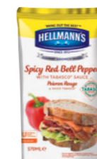
Poivron rouge & Sauce TABASCO® 5 x 570 mL 8712100472152