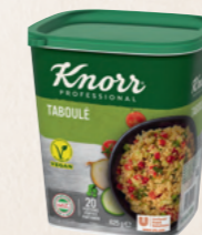
Couscous Taboulé 6 x 625 g • 20 Portions 3011360084231