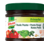
Pesto Rouge 2 x 340 g 8711100647331