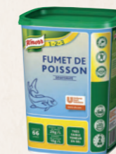
Fumet de Poisson faible teneur en sel 6 x 1 kg • jusqu'à 66 L 8722700109969