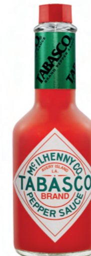
TABASCO® Rouge 12 x 350 mL 3250541476001