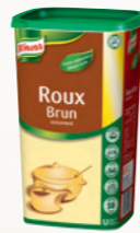
Roux Brun 6 x 1 kg • jusqu'à 50 L 3011360006707