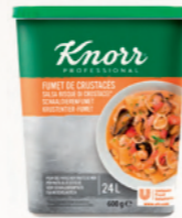
Fumet de Crustacés 6 x 600 g • jusqu'à 24 L 8711200461936