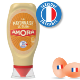
Mayonnaise de Dijon 12 x 395 g 8711200381654