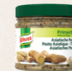
Thai 2 x 340 g 8711200321346