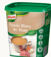
Fonds Blanc de Veau 6 x 750 g • jusqu'à 50 L 3011360085009