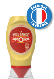
Moutarde 9 x 265 g 8711200381647