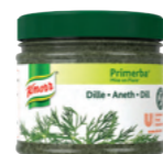
Aneth 2 x 340 g 8711200368006