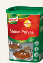
Poivre 6 x 900 g • jusqu'à 10 L 3011360040817