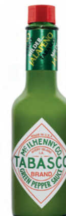
TABASCO® Vert 12 x 150 mL 8714100810491