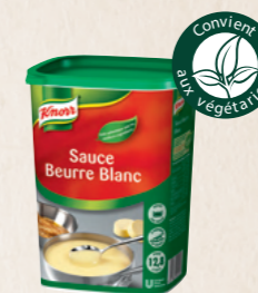
Beurre Blanc 6 x 1 kg • jusqu'à 12,8 L 3011360045539