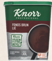
Fonds Brun Lié 6 x 750 g • jusqu'à 30 L 8711200461837