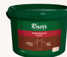
Fonds Brun Lié 1 x 3 kg • jusqu'à 150 L 8714100692608