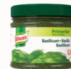
Basilic 2 x 340 g 8711100647348