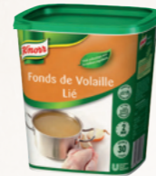
Fonds de Volaille Lié 6 x 750 g • jusqu'à 30 L 3011360017307