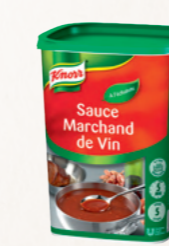
Marchand de Vin 6 x 850 g • jusqu'à 5 L 3011360041951