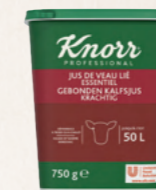
Jus de Veau Lié 6 x 750 g • jusqu'à 50 L 8712566087464