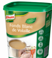
Fonds Blanc de Volaille 6 x 750 g • jusqu'à 50 L 8722700093145