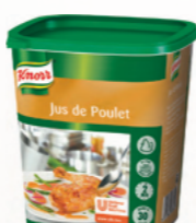
Jus de Poulet 6 x 750 g • jusqu'à 30 L 3011360083845