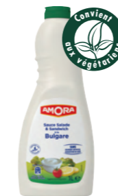
Sauce Salade Bulgare 6 x 1 L 8722700253549