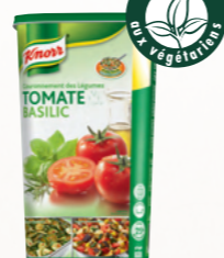
Tomate & Basilic 6 x 1 kg 8718114736884