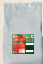
Roux Blanc 2 x 10 kg • jusqu'à 125 L 8712100422911