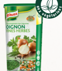
Oignon & Fines Herbes 6 x 1 kg 3011360021175