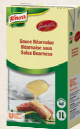
Béarnaise 6 x 1 L • 20 portions 3011360014344