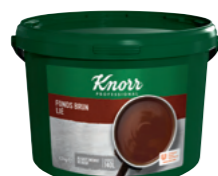
Fonds Brun Lié 1 x 3,5 kg • jusqu'à 140 L 8711200469604