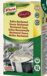
Béchamel 6 x 1 L • 20 portions 8413800001115