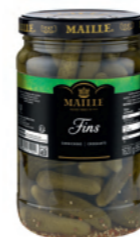
Cornichons Fins Sélection Grand Croquant 6 x 950 g 3036810611041