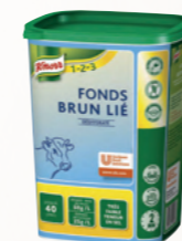
Fonds Brun Lié faible teneur en sel 6 x 1 kg • jusqu'à 40 L 8722700109693