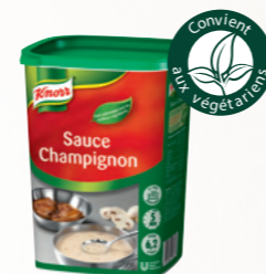
Champignon 6 x 800 g • jusqu'à 6,2 L 8712566213627