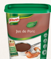
Jus de Porc 6 x 750 g • jusqu'à 30 L 3011360083852