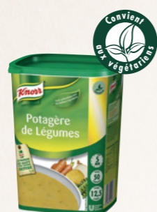
Potagère de Légumes 6 x 875 g • jusqu'à 12,5 L 3011360040176