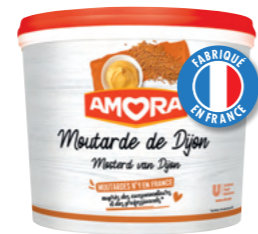
Moutarde de Dijon 1 x 5 kg 8720182299093