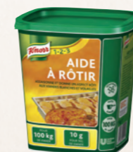
Aide à rôtir 6 x 1 kg • Pour 100kg de viande 3011360040251