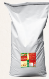
Roux Blanc 6 x 20 kg • jusqu'à 1000 L 8711100637066