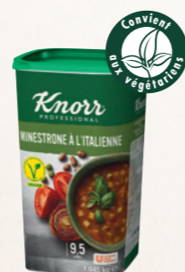
Minestrone à l'Italienne 6 x 1,045 Kg • jusqu'à 9,5 L 8710604730532