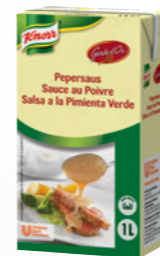
Poivre 6 x 1 L • 20 portions 3011360010650