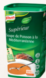
Soupe de Poisson à la Méditerranéenne 6 x 1 Kg • jusqu'à 12,5 L 8712566458462