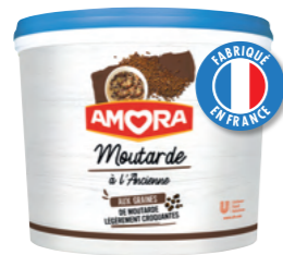
Moutarde à l'Ancienne 1 x 5 kg 8720182239495