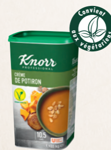
Crème de Potiron 6 x 1,55 Kg • jusqu'à 10,5 L 8710604744706