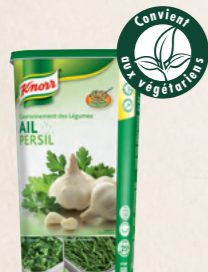
Ail & Persil 6 x 1 kg 3011360040268