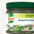
Bouquet de Provence 2 x 340 g 8711200368068