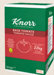
Base Tomato 10 kg 8720182185938