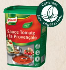
Tomate à la Provençale 6 x 900 g • jusqu'à 6 L 3011360040510