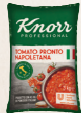
Tomato Pronto Napoletana 4 x 3 kg 8712566255177