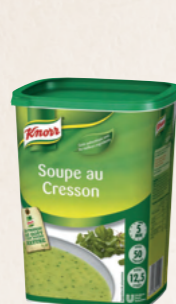
Soupe au Cresson 6 x 750 g • jusqu'à 12,5 L 3011360041098