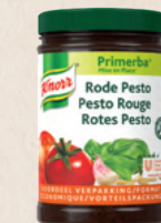
Pesto Rouge 2 x 700 g 8722700772491