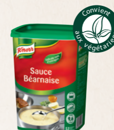
Béarnaise 6 x 870 g • jusqu'à 9,6 L 3011360040473