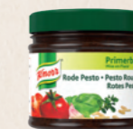
Pesto Rouge 2 x 340 g 8711100647331