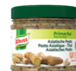
Thaï 2 x 340 g 8711200321346