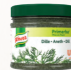
Aneth 2 x 340 g 8711200368006