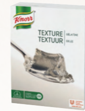
Texture Gélatine 6 x 1 kg 8714100795538