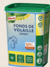
Fonds de Volaille faible teneur en sel 6 x 1 kg • jusqu'à 66 L 8722700109907

En 2020, nous avons introduit du plastique recyclé circulaire dans les emballages de certains fonds Knorr Professional.