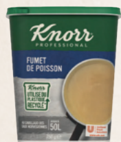
Fumet de Poisson 6 x 750 g • jusqu'à 50 L 8711200461912