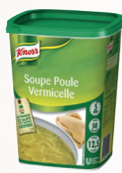
Soupe Poule Vermicelle 6 x 825 g • jusqu'à 12,5 L 8711200574391