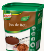
Jus de Rôti 6 x 750 g • jusqu'à 30 L 3011360083838