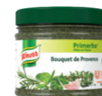
Bouquet de Provence 2 x 340 g 8711200368068