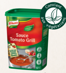
Tomato Grill 6 x 900 g • jusqu'à 6 L 3011360041180