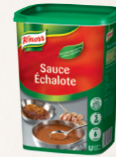
Échalote 6 x 900 g • jusqu'à 6 L 3011360083920