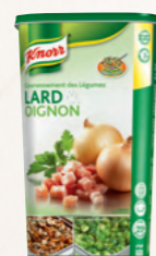
Lard & Oignon 6 x 1 kg 3011360029485