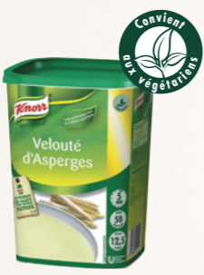
Velouté d'Asperges 6 x 875 g • jusqu'à 12,5 L 3011360041111