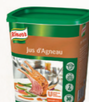
Jus d'Agneau 6 x 750 g • jusqu'à 30 L 3011360083869