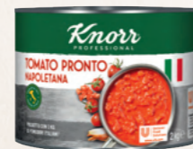
Tomato Pronto Napoletana 6 x 2 kg 9000275766107