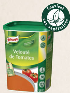
Velouté de Tomates 6 x 925 g • jusqu'à 12,5 L 8711200518319