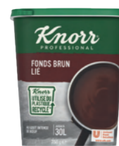
Fonds Brun Lié 6 x 750 g • jusqu'à 30 L 8711200461837