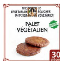
Palet Végétalien 30 x 80 g 8720182805539