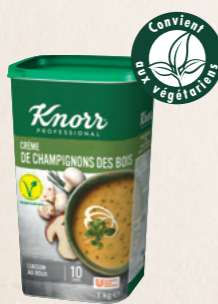
Crème de Champignons des Bois 6 x 1 Kg • jusqu'à 10 L 87117163956083