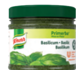
Basilic 2 x 340 g 8711100647348