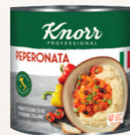
Peperonata 6 x 2,6 kg 8711100648338