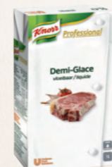
Jus Demi-Glace 6 x 1 L 8718114713090