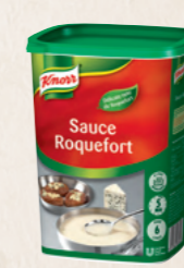
Roquefort 6 x 780 g • jusqu'à 6 L 3011360083906