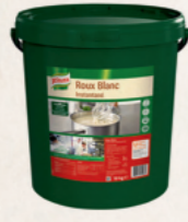
Roux Blanc 6 x 10 kg • jusqu'à 500 L 8718114912981