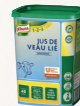
Jus de Veau Lié faible teneur en sel 6 x 1 kg • jusqu'à 40 L 8722700109846