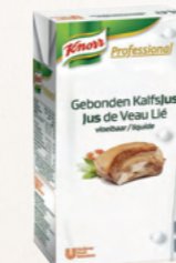
Jus de Veau Lié 6 x 1 L 8718114713212

Explorer de nouvelles saveurs et techniques pour diversifier sa cuisine