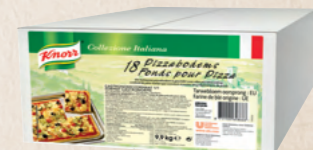
Fond de Pâte pour pizza 1 x 9,9 kg • 18 fonds 8711100648666