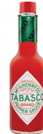
TABASCO® Rouge 12 x 150 mL 8712100068171