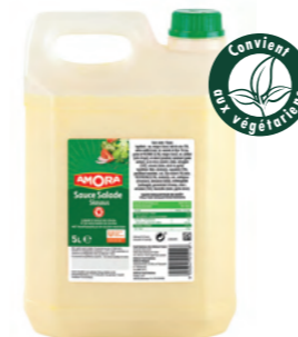
Sauce Salade 4 x 5 L 3250541015118