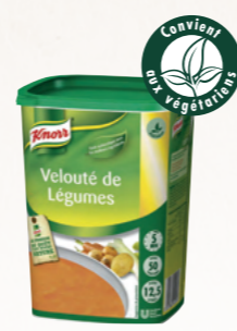
Velouté de Légumes 6 x 940 g • jusqu'à 12,5 L 3011360041074