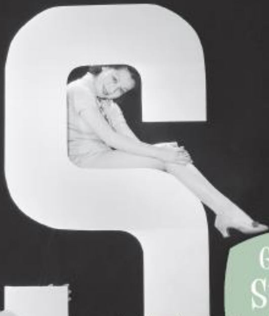
Grille 5 : Sudoku